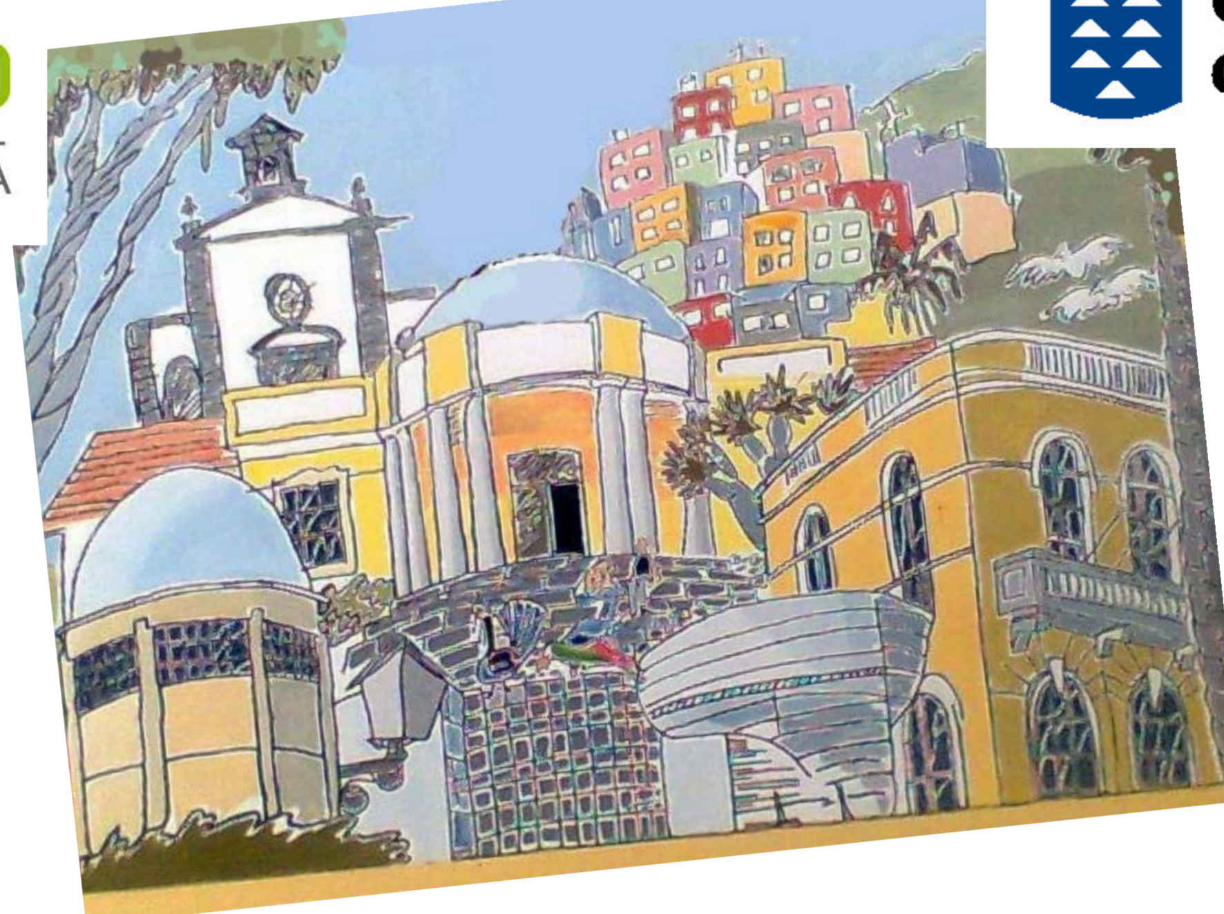
Alegoría de la fachada del centro y lo más representativo del barrio de San José.

El curso 2009/10, hemos decidido consolidar lo trabajado durante el curso anterior, con la novedad de la confección de mascotas ecológicas en el área de francés utilizando como medio de comunicación la lengua francesa.