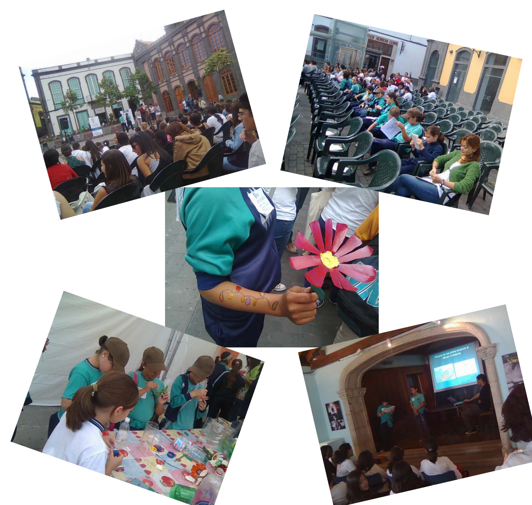
Encuentro centros RedECOS en Arucas, mayo 2009