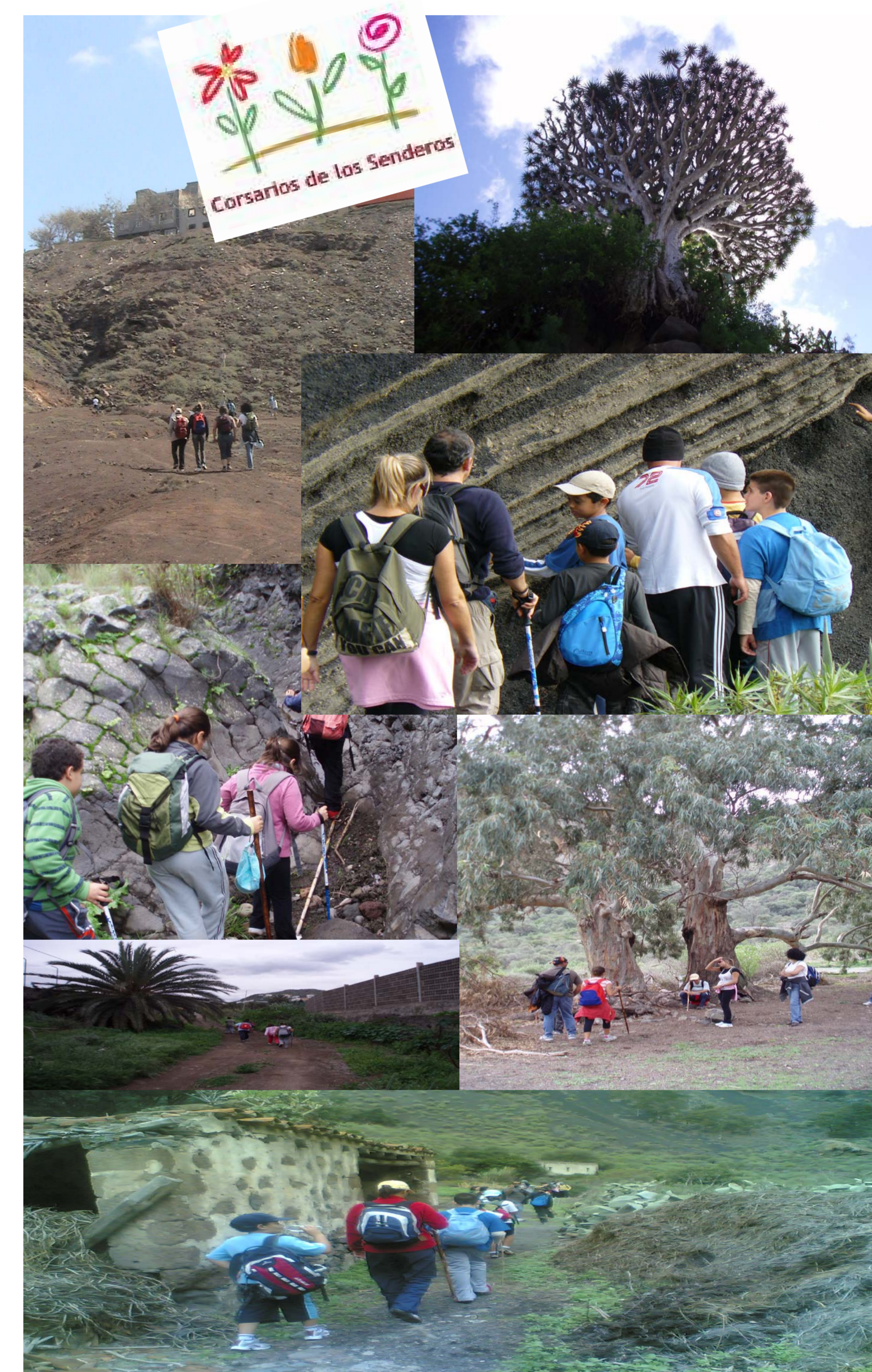
Conociendo nuestro entorno con nuestra familia en "Corsarios de los senderos".

Consejería de Educación, Universidades, Cultura y Deportes