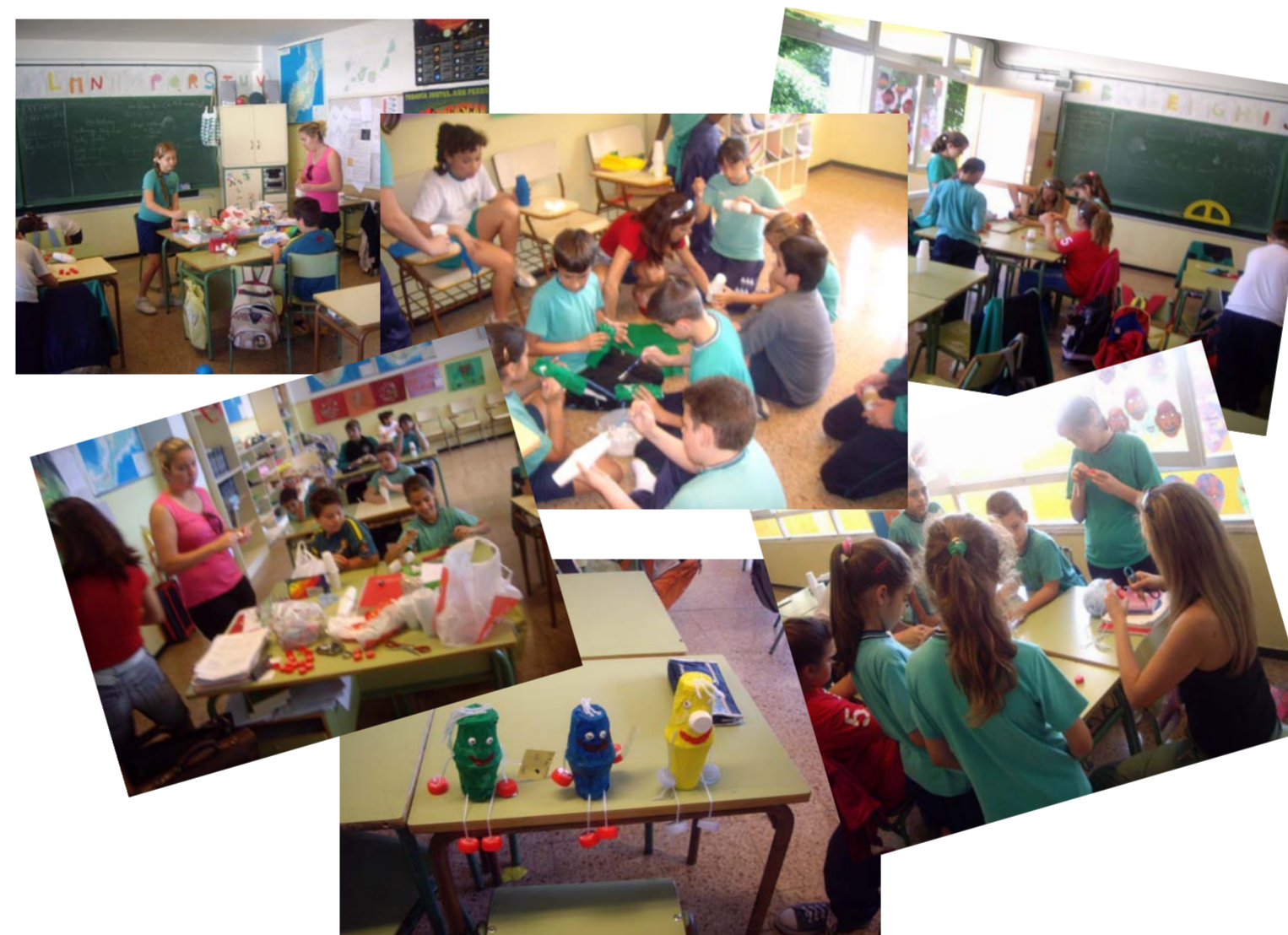
Participación familiar en el día del padre y día de la madre.