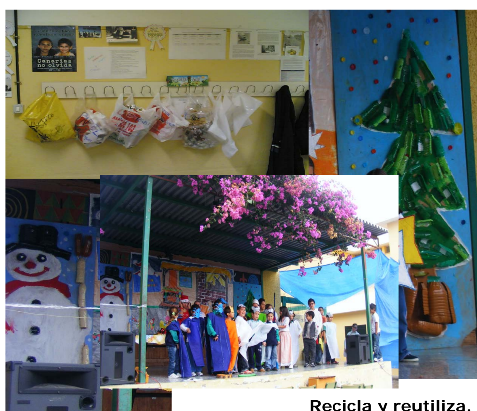
Recicla y reutiliza.